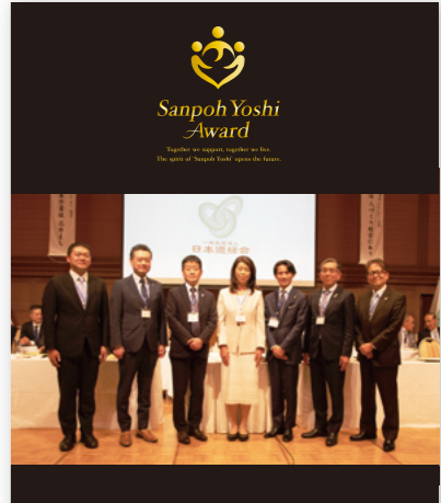
「三方よしアワード」の表彰