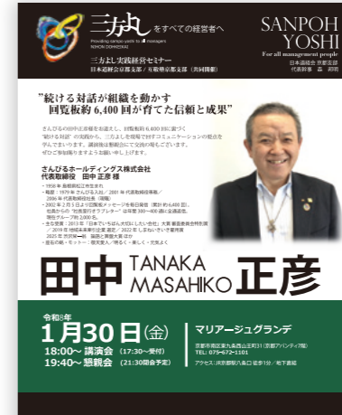
支部主催経営セミナー