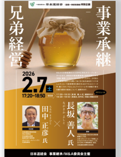
事業承継セミナー