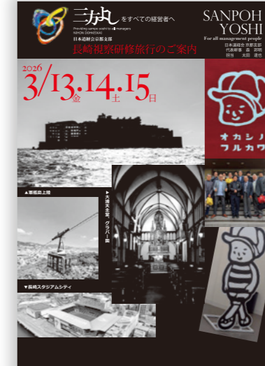
支部交流研修 (京都→長崎)