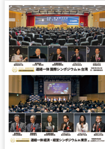
道経一体シンポジウム in 台湾・東京