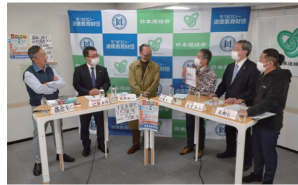
全国ライブ配信セミナー (東京・埼玉・千葉・神奈川の4支部による共同開催)

所属支部以外の活動に参加することもできます。 近年はインターネットライブ配信を用いて地域を超えて参加できる事業も行われています。