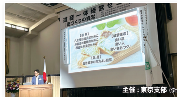
主催：東京支部(学士会館)