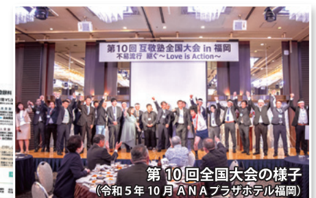
第10回全国大会の様子 (令和5年10月ANAプラザホテル福岡)