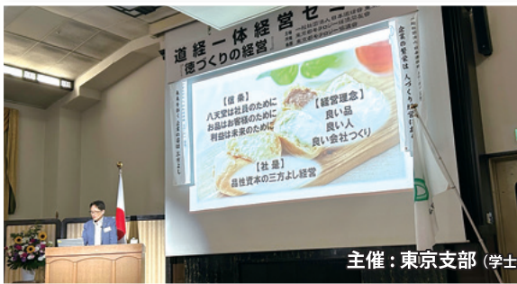
主催：東京支部（学士会館）