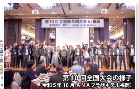
第10回全国大会の様子 （令和5年10月 ANA プラザホテル福岡）